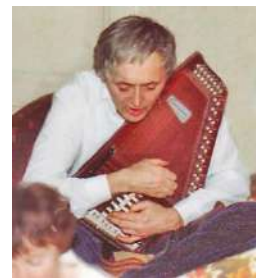
Du touret à meuler à la cithare autoharp.