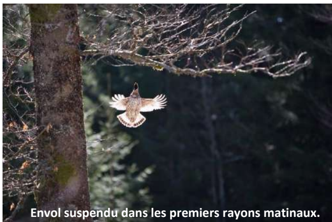
Envol suspendu dans les premiers rayons matinaux.

Il y a près d'une trentaine d'années (entre 1986 et 1990), une prospection méticuleuse permettait de recenser 20 à 25 couples ou territoires de gélinottes rien que pour la vallée de Masevaux (entre Sewen et Lauw). Exception faite des Vosges du nord, la situation de l'espèce ne semblait pas particulièrement préoccupante en montagne vosgienne, bien que sa disparition de la plupart des forêts de plaine fasse déjà l'objet d'un resserrement de l'aire de présence de longue date d'après les recensements décennaux de l'ONCFS. Aujourd'hui, les populations se sont effondrées partout, les anciens habitats sont désertés et il ne subsiste plus qu'une toute petite population relique dans la vallée de la Thur à l'échelle de nos deux vallées.