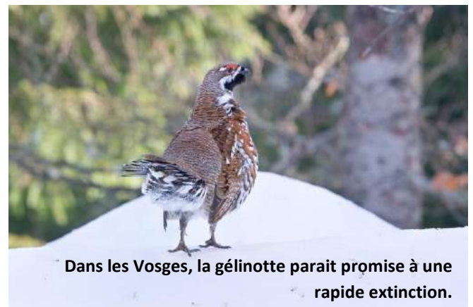
Dans les Vosges, la gélinotte paraît promise à une rapide extinction.

la perte définitive d'un pan entier du patrimoine génétique de l'espèce.