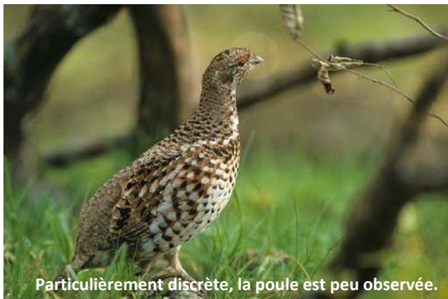
Particulièrement discrète, la poule est peu observée.

par la forêt boréale du continent eurasiatique (la taïga représente son habitat idéal). Les populations d'Europe occidentale sont les plus morcelées et les plus fragilisées. En France, elle occupe encore les massifs des Vosges, du Jura et des Alpes, mais c'est dans les Vosges qu'elle connaît une situation particulièrement alarmante, à tel point que sa disparition risque de précéder celle du grand tétras (à noter qu'elle a disparu de Forêt Noire au début du XX e siècle).