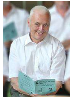
2007 : concert du Chœur des Trois Abbayes à Jettingen (Allemagne).