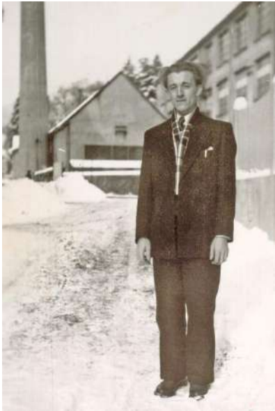
Vers 1950, au début de la rue de la Renardière. À gauche : la cheminée de la filature Zeller.