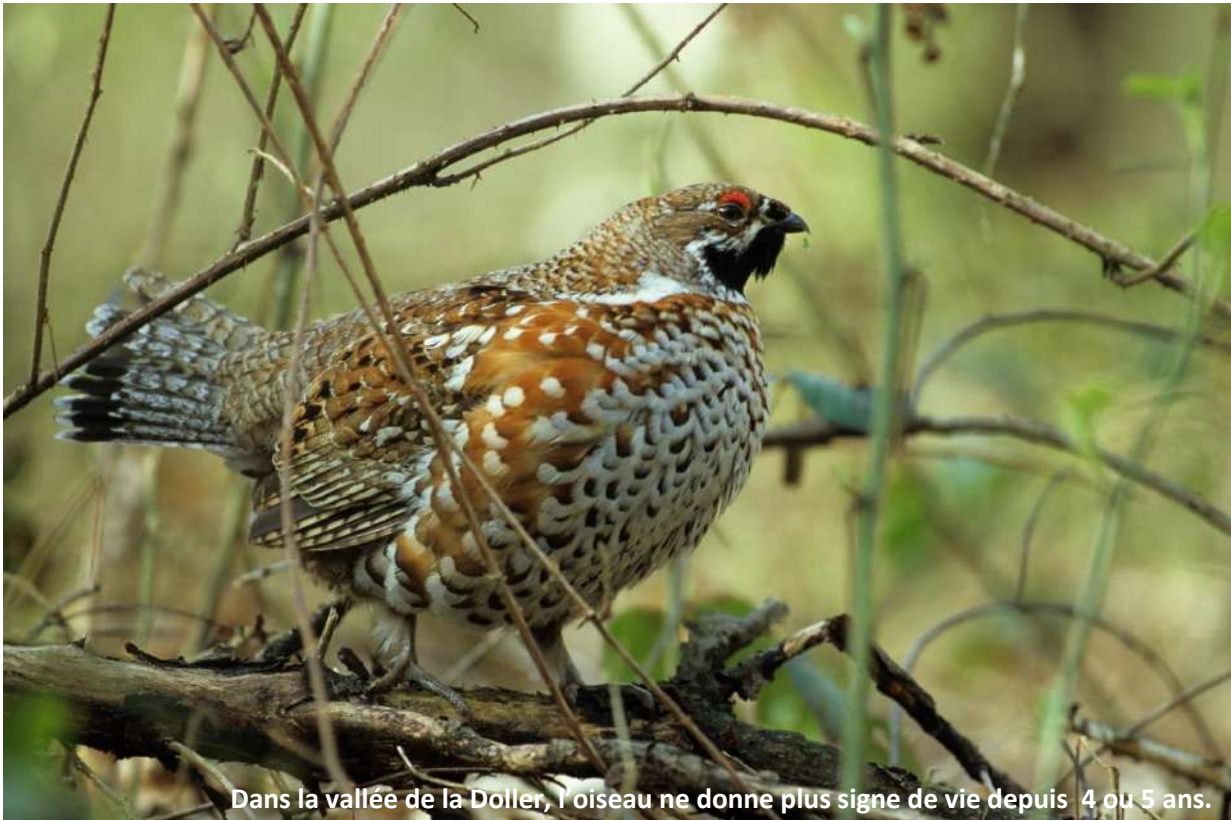
Dans la vallée de la Doller, l'oiseau ne donne plus signe de vie depuis 4 ou 5 ans.

La gélinotte des bois était encore bien présente dans la vallée il y a une bonne vingtaine d'années, elle occupait aussi quelques massifs forestiers sur le ban communal d'Oberbruck jusqu'au milieu des années 90. Mais ses populations se sont effondrées à l'échelle du massif vosgien en quelques décennies et rien ne semble vouloir enrayer le scénario d'une disparition totale à brève échéance. Voici quelques pistes pour tenter de comprendre la situation et une brève présentation d'un oiseau peu connu et très discret.