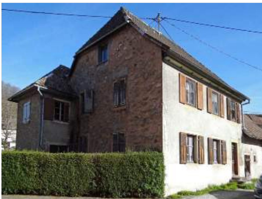
Ferme Boecklé à Oberbruck

La Fondation du patrimoine, la commune d'Oberbruck et l'association des Amis de la Haute Vallée de la Doller lancent conjointement un appel à dons pour sauver la ferme Boecklé à Oberbruck. Acquis par la commune, cette ferme fait partie d'un ensemble de maisons anciennes situées au plein cœur du village.