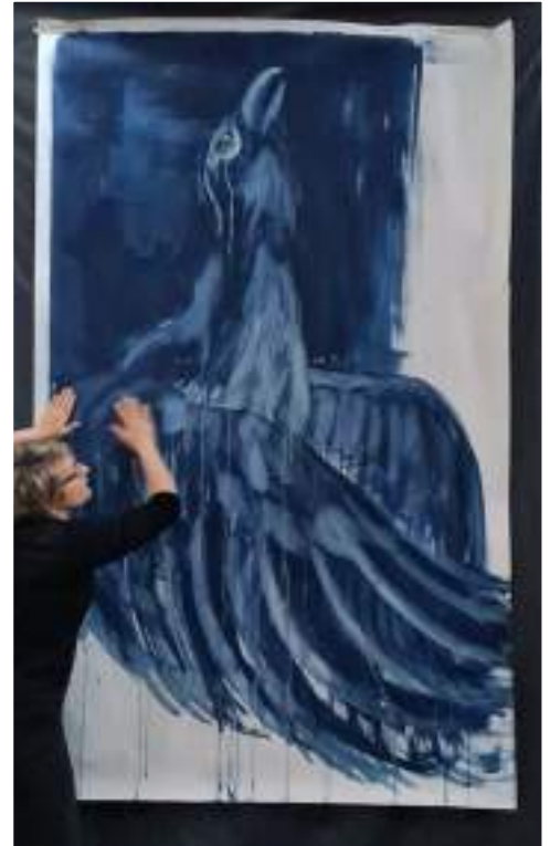
Exposition au Foyer Communal "la poule mouillée"

Je partagerai mon travail avec les habitants en fin de résidence, ce sera avec un grand plaisir !