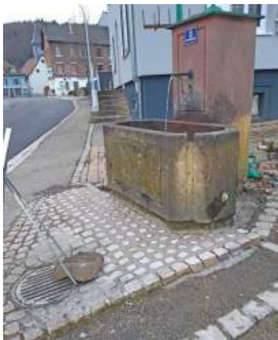
Réparation de la fontaine