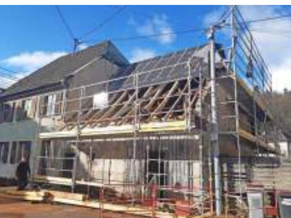
Les travaux de la maison Boecklé