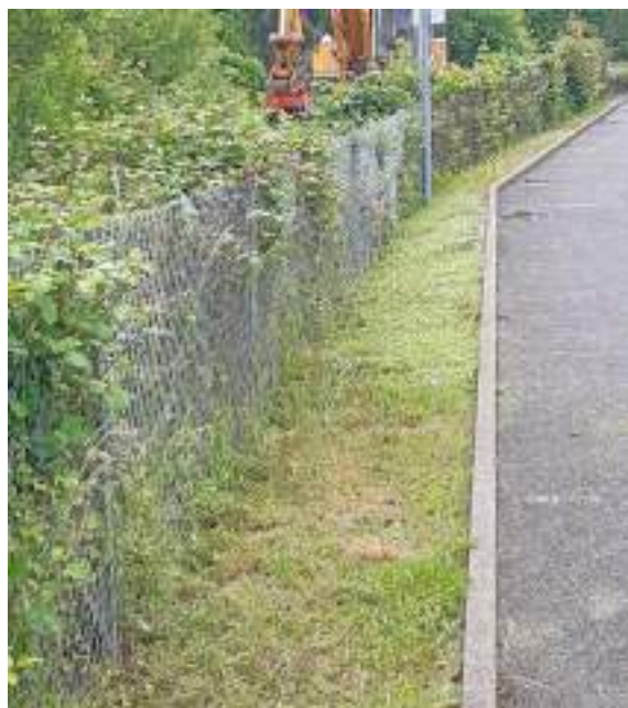
Le parking du Foyer-Communal