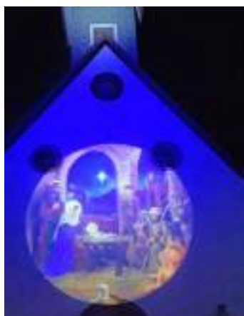
Décoration de Noël