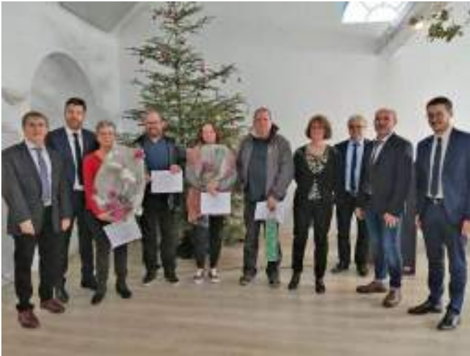
▶ Vœux 2023 à Oberbruck avec les donateurs de sang et les élus