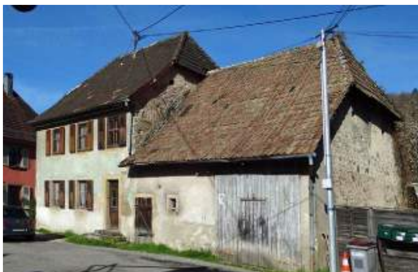
Ferme Boecklé à Oberbruck