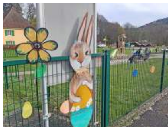
Course aux oeufs 2024