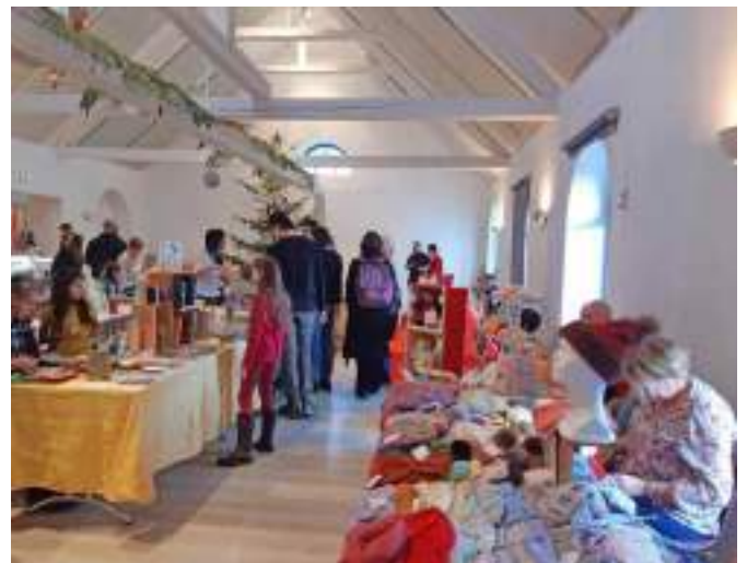
Marché de Noël et visite du St Nicolas