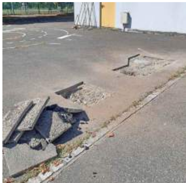
Réparations dans la cour d'école