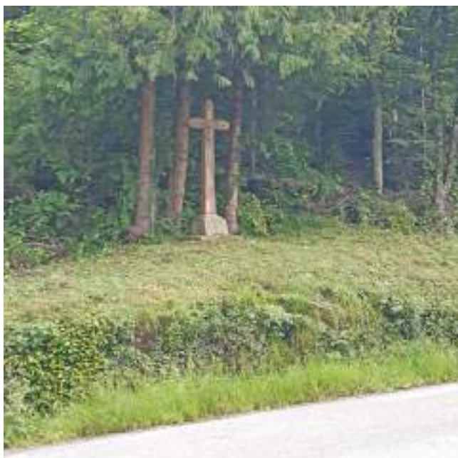
Le calvaire à l'entrée du village