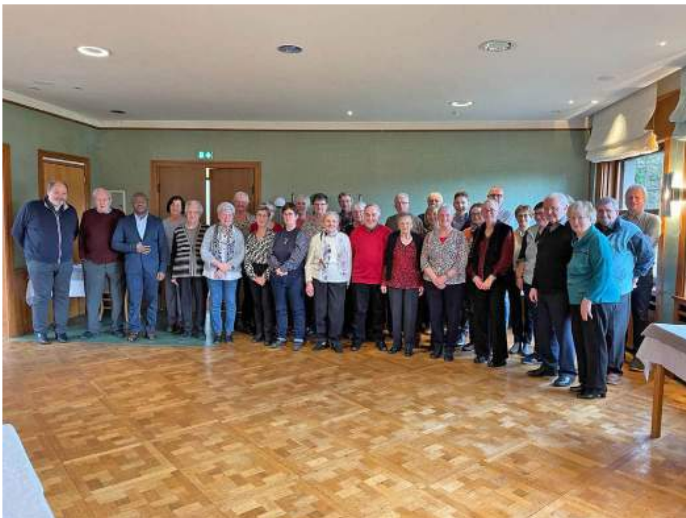
Photo de groupe réalisée après le repas du 10 février 2024.