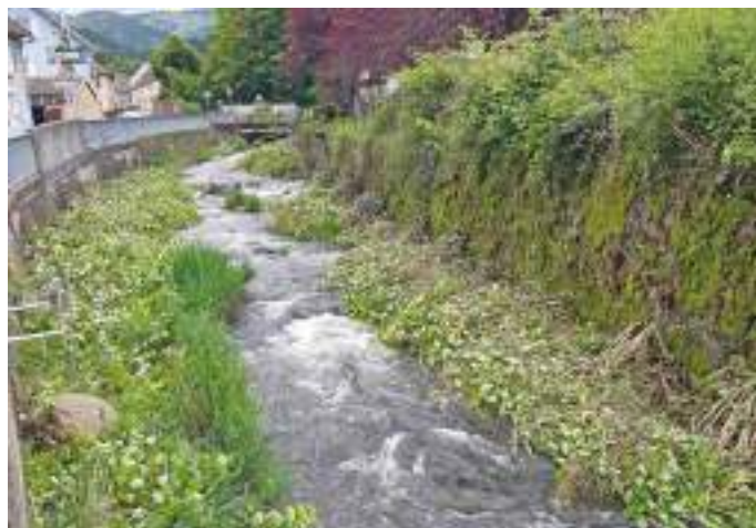
Eradication de la renouée dans le Seebach