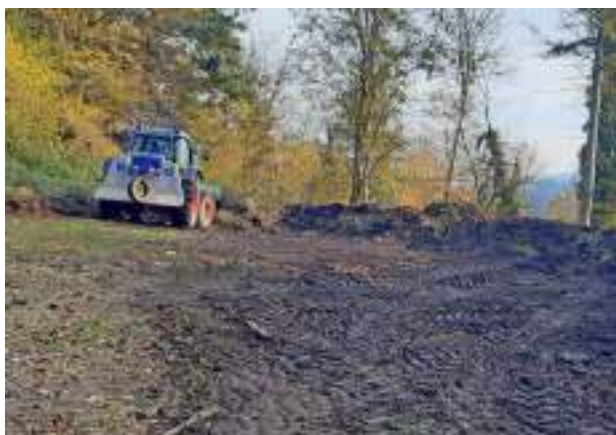
Nettoyage aux déchets verts du Steinbrennle