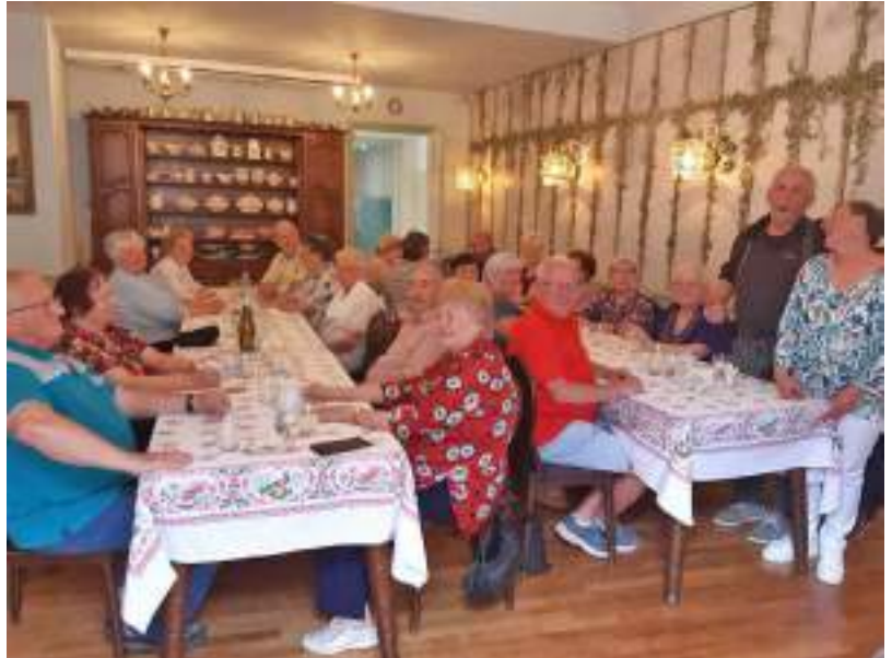
Repas de fin d'année à l'Hostellerie Alsacienne à Masevaux